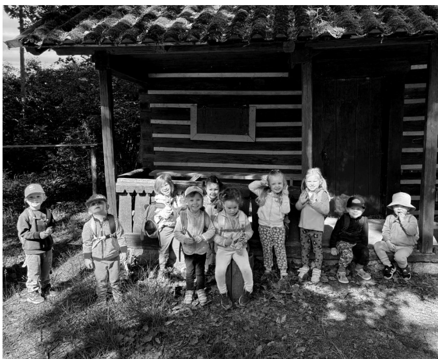
u chaloupky v lese